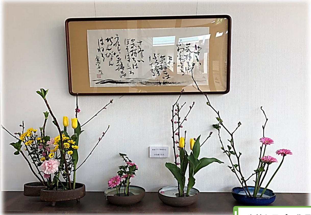
生花クラブの作品