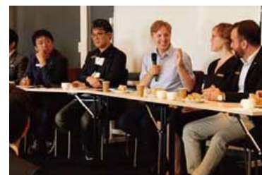
JCI公開ミーティング