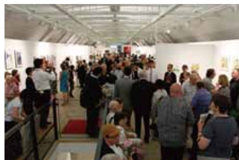
「アール・ブリュット 日本とスウェーデン (ART BRUT - SVERIGE OCH JAPAN)」