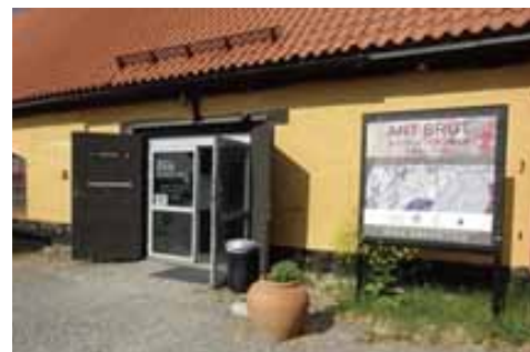
会場：エズヴィック・コンストハル (Edsvik Konsthall)