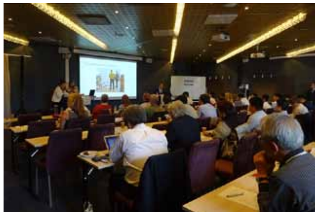
国際フォーラム会場の様子