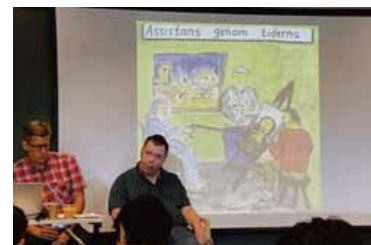
パーソナルアシスタンス研修会

期間中は、日本から約60名がスウェーデンを訪問し、現地の特別支援学校やアトリエ、精神科病院等の視察にまわり、現地の福祉や美術、医療関係者との交流が図られました。