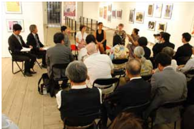
記念対談「障害者の文化芸術の可能性について」