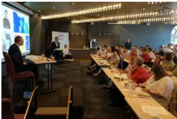
国際フォーラム会場：スカンディック・スター・ソレントウナ

6月3日（日）13:00～16:30に開催し、約70名が参加しました。「日本とスウェーデンの文化交流の可能性」「作品の生まれるところ」「表現と人権」という3つのテーマで日本とスウェーデンの専門家9名がスピーチを行いました。