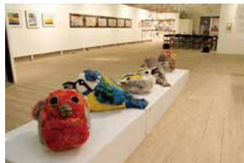
スウェーデン作品