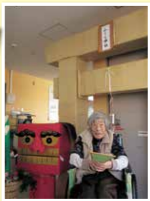
今年も 宜しくお願いします。