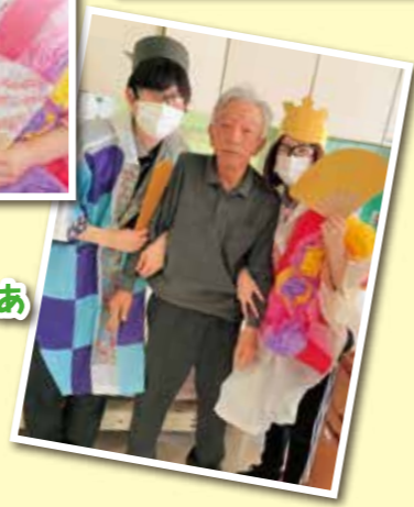
お雛さま、 きれいだなあ