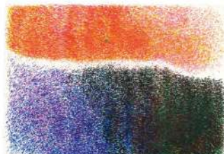
草薙陵太 無題 2016年頃