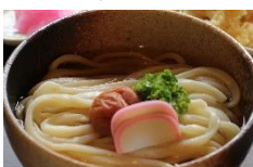
いっぺきうどん コシのあるもちもち麺。 打ち立ての本格生めん です。 190円～