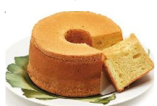
シフォンケーキ 軽くてやわらかいメレ ングたっぷり。ホール でいかが。 1500円