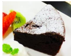
ガトーショコラ 米粉を使ったしっとり 食感。甘さとほろ苦さ が絶妙。 300円～