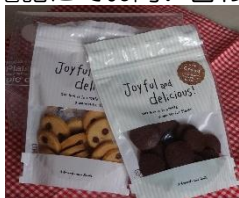
クッキーセット プレーンとココアを かわいいパックに詰 めました。 500円

ご家庭や職場でパーティーや催し多い時期ですね。まずはお電話にてお問い合わせください。