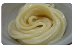
米粉の麺 米粉 100%の麺でつる っとした新しい食感を お楽しみください 210円