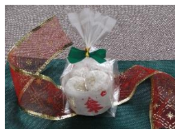
スノーボール アーモンドパウダーの 風味がお口のなかで とろけます。300円